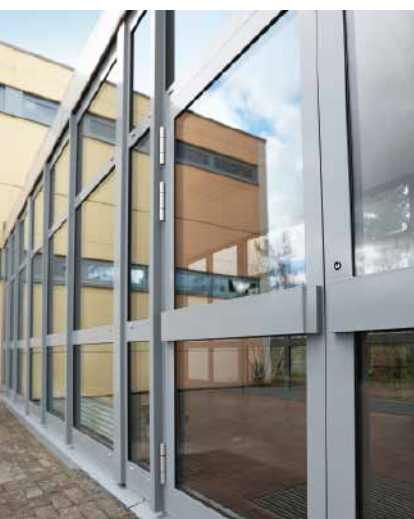
Алюминиевая дверная система Schüco ADS 50.NI Schüco Aluminium door system ADS 50.NI

Алюминиевая дверная система Aluminium Door System